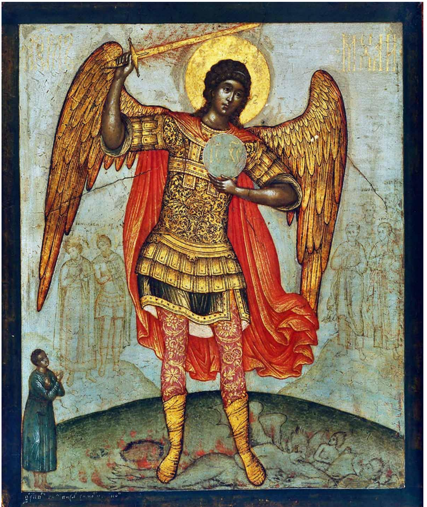
Архангел Михаил, попирающий дьявола