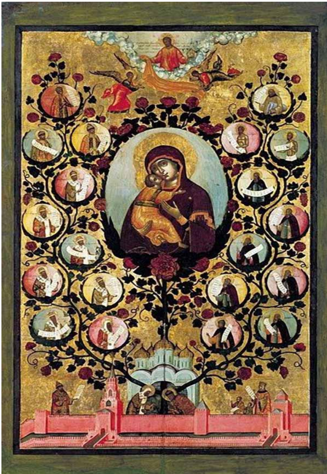
Богоматерь Владимирская (Древо Московского государства - Похвала Богоматери Владимирской

написанной в 1668 г., он изображает царя Алексея Михайловича, пытаюсь передать его портретные черты. Известно, что Ушаков писал парсуны. В изображении интерьера или пейзажа на иконах он иногда использует принципы линейной перспективы.